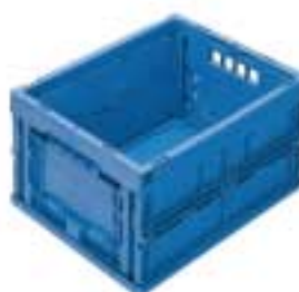
Art. F PF 4851 BB 04 Außenabmessungen: mm 400x300x220h Nutzabmessungen innen: mm 365x265x215h