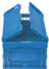
Art. F PF 4851 BA 04 Außenabmessungen: mm 400x300x230h Nutzabmessungen innen: mm 365x265x210h

Aus blauem Polypropylen hergestellt, sind die 400x300 mm großen Faltkästen ideal zur Aufnahme von kleinem Material. Sie sind mit geschlossenen Wänden und Boden und mit Griffen an den kurzen Seiten ausgestattet und können mit dem zweiflügeligen Deckel zugemacht werden.