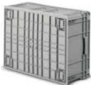
Serienmäßig verstärkter Boden