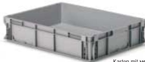
Kästen mit verstärktem Boden Art. F PA 8751 A0 01 Außenabmessungen: mm 800x600x170h Nutzabmessungen innen: mm 756x556x136h