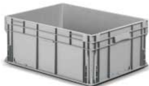
Kästen mit verstärktem Boden Art. F PA 9351 A0 01 Außenabmessungen: mm 800x600x325h Nutzabmessungen innen: mm 756x556x291h