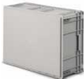
Glatter Boden auf Anfrage