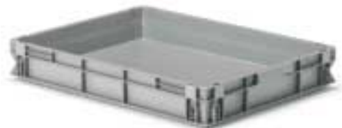
Kästen mit verstärktem Boden Art. F PA 8551 A0 01 Außenabmessungen: mm 800x600x120h Nutzabmessungen innen: mm 756x556x86h