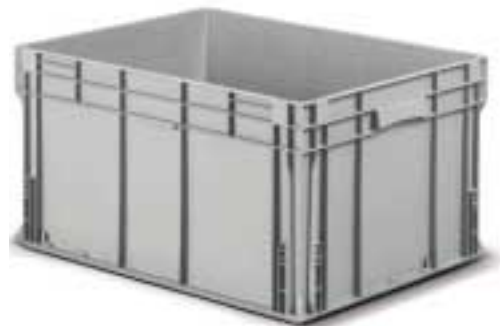
Kästen mit verstärktem Boden Art. F PA 9751 A0 01 Außenabmessungen: mm 800x600x430h Nutzabmessungen innen: mm 756x556x396h