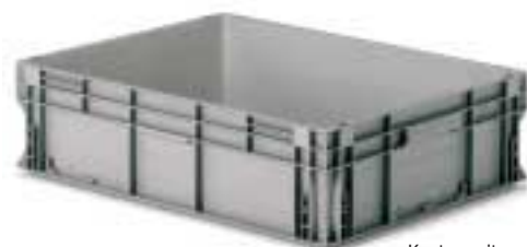
Kästen mit verstärktem Boden Art. F PA 8951 A0 01 Außenabmessungen: mm 800x600x220h Nutzabmessungen innen: mm 756x556x188h