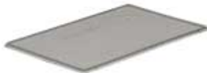
Art. F PA 0951 00 01 Aufklappbarer Deckel Abmessungen: mm 600x400 Gewicht: g. 722