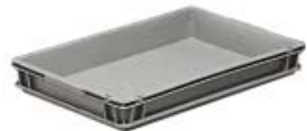
Art. F PA 5651 AO 01 Außenabmessungen: mm 600x400x78h Nutzabmessungen innen: mm 555x355x58h