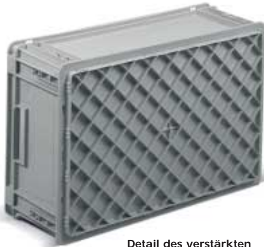
Detail des verstärkten Bodens