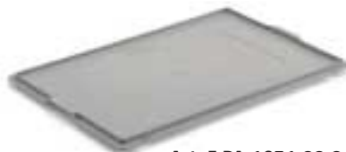
Art. F PA 1C51 00 01 Deckel Abmessungen: mm 600x400 Gewicht: gr. 740