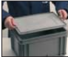
Art. F PA 1B51 00 01 Deckel Abmessungen: mm 400x300 Gewicht: g. 360