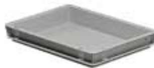
Art. F PA 3251 AO 01 Außenabmessungen: mm 400x300x55h Nutzabmessungen innen: mm 355x255x35h