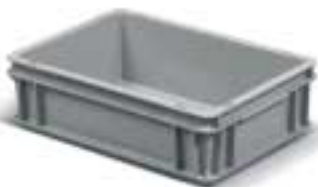
Kasten mit geschlossenem Boden Art. F PA 4051 AO 01 Außenabmessungen: mm 400x300x120h Nutzabmessungen innen: mm 355x255x100h