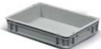
Art. F PA 3651 AO 01 Außenabmessungen: mm 400x300x78h Nutzabmessungen innen: mm 355x255x58h