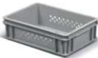
Kasten mit durchbrochenem Boden Art. F PA 4051 EO 01 Außenabmessungen: mm 400x300x120h Nutzabmessungen innen: mm 355x255x100h