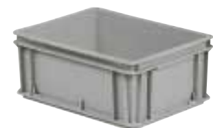
Kasten mit geschlossenem Boden Art. F PA 4451 AO 01 Außenabmessungen: mm 400x300x170h Nutzabmessungen innen: mm 355x255x150h